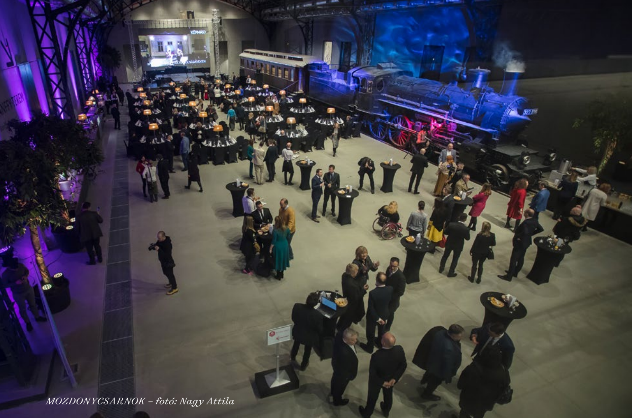
MOZDONYCSARNOK – fotó: Nagy Attila

teljesített szolgálatot, büfé és étterem működik, az emeleti teraszokon pedig tematikus kiállításokon mutatjuk be az intézmény és az operajátzás történetét.