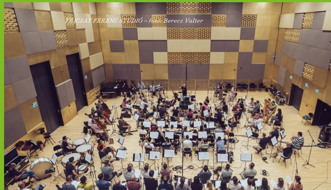
FRICSAY FERENC STÚDIÓ

Az Eiffel-csarnokként elhíresült, 1886-ban átadott műemléket Feketeházy János (1842–1927) tervezte. Nevéhez olyan jelentős fémszerkezetű építmények fűződnek, mint a szegedi közúti Tisza-híd, a budapesti Ferenc József (mai Szabadság) híd, a Keleti pályaudvar vágánycsarnokának és a Magyar Állami Operaháznak az acél tetőszerkezete. Az épület vasutas múltjára két mozdony is emlékezteti a látogatókat: egy felújított 327-es gőzmozdony a Műhelyház központi terében, valamint egy szintén restaurált, a 301-es szériából való 301.006-os gőzös, melynek otthona a csarnokot körülvevő hatalmas park. A Mozdonycsarnok a komplexum szíve: ide érkeznek a látogatók, innen közelíthető meg a színházterem, a háziszínpad és a neves karmesterről, Fricsay Ferencről elnevezett stúdió, ahol az Opera professzionális környezetben tudja rögzíteni hangfelvételeit. Az Eiffel Műhelyház nemcsak óriási kulturális beruházás, hanem közösségi tér is, hiszen a közönség kellemes atmoszférában várhatja az előadások kezdetét vagy töltheti el a felvonások közötti szünetet. A mozdonyhoz kapcsolt, szintén műemlék étkezőkocsiban, mely valaha az Orient Expresszen