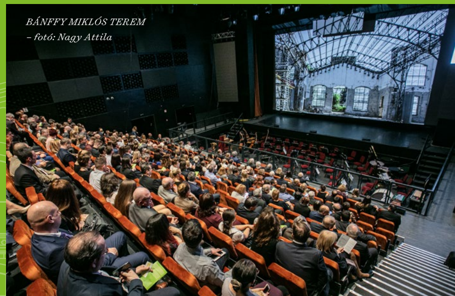
BÁNFFY MIKLÓS TEREM