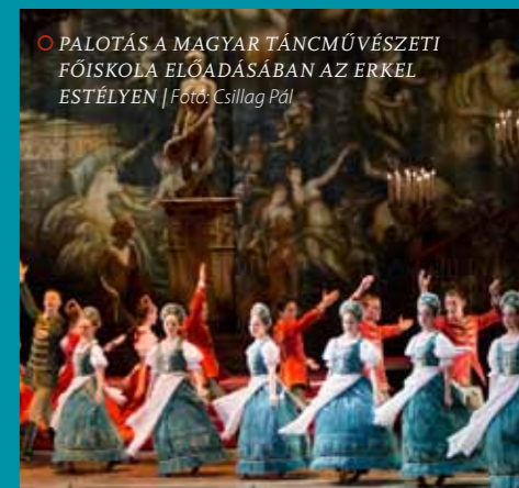
PALOTÁS A MAGYAR TÁNCMŰVÉSZETI FŐISKOLA ELŐADÁSÁBAN AZ ERKEL ESTÉLYEN

befektetésnek tekintik a magyar operajátszás jövőjébe. A gálaest bevételéhez a belépőjegyek megvásárlásán kívül bárki – magánember vagy cég – hozzájárulhatott. A gálán – amelynek házigazdái Miklósa Erika és Ókovács Szilveszter voltak – többek között népszerű Erkel-, Verdi-, Puccini-, Mozart-, Bizet-, Strauss- és Leoncavallo-áriák csendültek fel a Magyar Állami Operaház Zenekarának közreműködésével, a Magyar Nemzeti Balett pedig egy modern táncfantáziával lépett színpadra, míg a Táncművészeti Főiskola növendékei palotást táncoltak. A gála háziasszonya, Miklósa Erika így fogalmazott arról, milyen fontos számára és az összes magyar művész számára az Erkel Színház. „Az Erkel Színházban debütáltam Papagenaként. Óriási élmény volt ott énekelni, varázslatos az akusztikája. Az Erkel az életünk részévé vált, hiányzik nekünk, és nagyon örülök, hogy a felújításához egy kicsit én is hozzájárulhatok.”