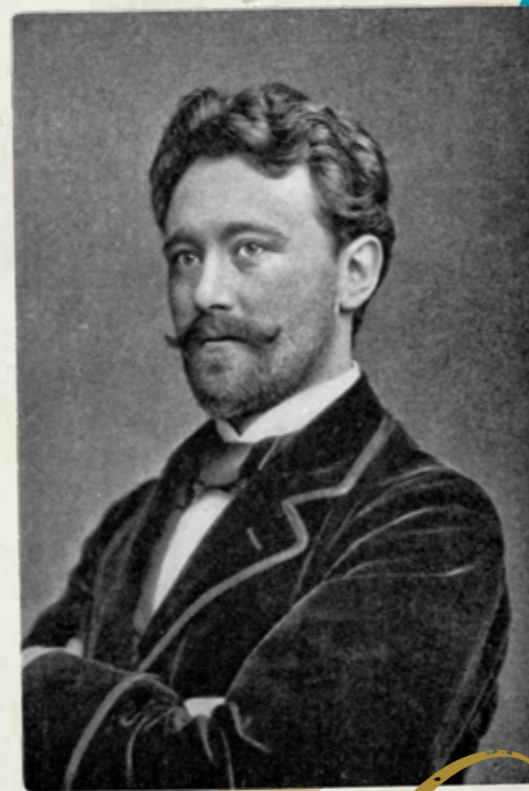
○ FELIX WEINGARTNER