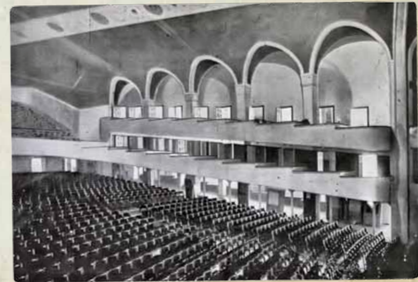
○ NÉPOPERA | Fotó: Vasárnapi újság (1911)