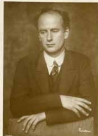
○ WILHELM FURTWÄNGLER

„Ez az este valóban diadala volt az olasz énekművészetnek, az emberi hang ama csodálatosan kikristályosodott, páratlanul differenciált kultúrájának, melynek csúcspontján a mai est hőse, Benjaminó Gigli áll. (...) Nála a legtüneményesebb hanghatásokat sem érezzük rafináltságnak. Olyan becsületes, nyílt, egyenes, mint egy nagy gyerek. Olyan soknak érzi mindazt, amit szívében érez, hogy hatalmas, gazdag, kincses tenorjának nincs semmi »hozzátennivalója«, de annál több kifejezni-valója. Olyan ostobán bele tud felejtkezni érzéseibe, hogy ezt