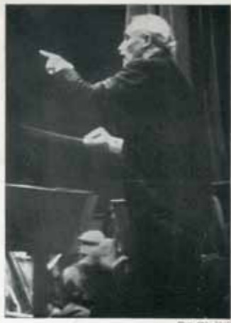
○ ARTURO TOSCANINI

„A tavasszal már négy éve lesz Arturo Toscanini első budapesti látogatásának, és azóta várták vissza, akik felejthetetlen élményként őrzik a nagy dirigens akkori előadását, és várták azok is, akik most gyönyörködhetnek először a világhírű karmester művészetében. Nem csoda tehát, hogy a magas helyárak és a mai gazdasági helyzet dacára is zsúfolásig megtelt a Városi Színház óriási nézőtere. (Őszinte elismerés a rádió vezetőségének, hogy a koncert kapcsolásával a szélesebb rétegek számára lehetővé tette legalább a közvetett meghallgatását.) A mai hangverseny jellemzésére nem mondhatunk többet, mint azt, hogy ez a Toscanini-hangverseny még az előzőt is felülmúlta, és most valóban nem a kritika, hanem csak hódolat hangján lehet szólni úgy a mesterek mesteréről, mint nagyszerű zenekarról. Akkor a New York-i filharmonikus zenekar (The Philharmonic-Symphony Society) bravúros együttesével volt nálunk, most a bécsi filharmonikusok élén jelent meg. (...) A műsor is kitűnően volt összeállítva: Mozart D-dúr szimfóniája , Brahms Haydn-változatok , Beethoven VII. szimfónia és Wagner Mesterdalnokok-nyitány .”