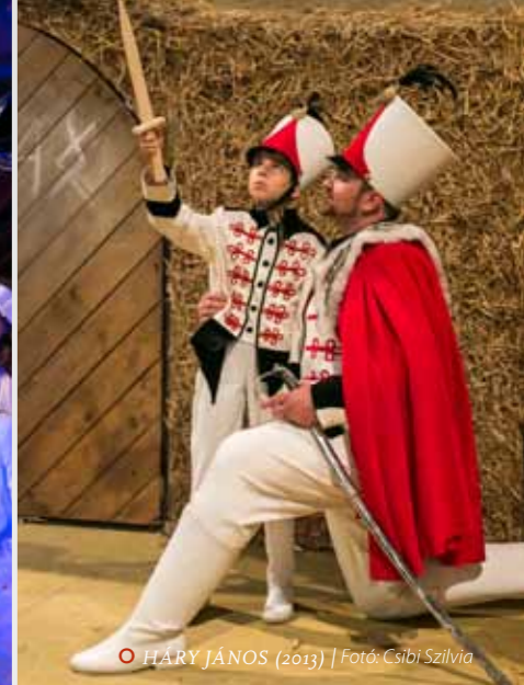
HÁRY JÁNOS (2013)