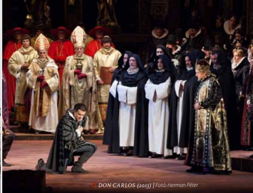
DON CARLOS (2013)