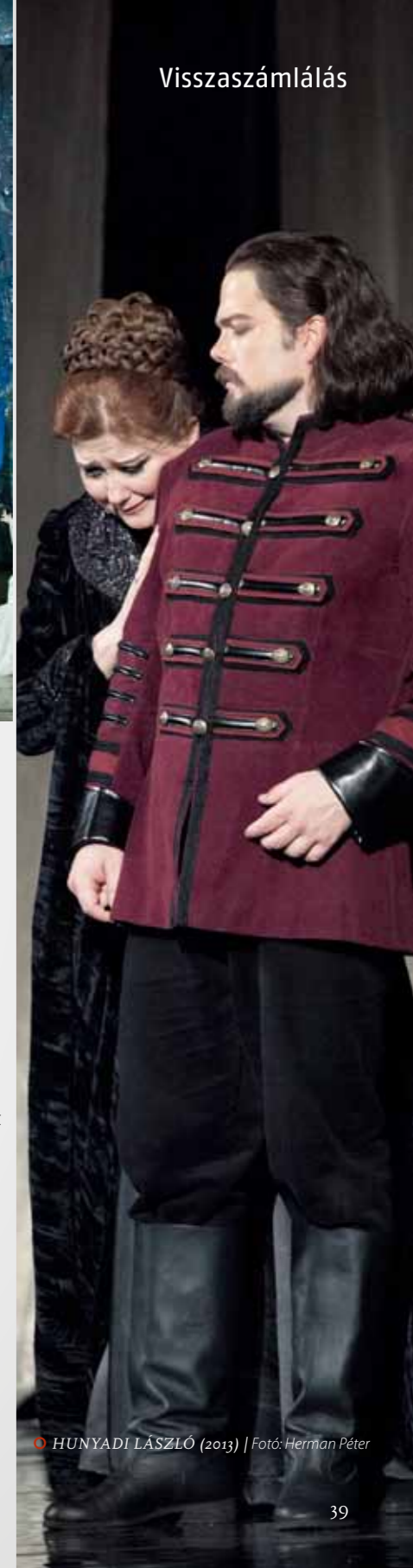
○ HUNYADI LÁSZLÓ (2013)

„Te, ezt lefényképezem!” – kiáltott fel izgatottan az egyik októberi Háy Jánosra osztályával érkező tizenéves fiú, aki rácsodálkozott a színház méreteire. „Menjünk középre, mert onnan mindkét képet jól megnézhetjük!” – húzta szüleit az emeleti nagybüfében a Bernáth Aurél-freskókhöz tökéletes rálátást biztosító helyre egy hatévesforma kislány. Az újonnan megnyitott épület lenyűgöző, az előadások élményt adóak. Az OperaKalandban résztvevők, a jegyvásárlók és a látók egyre növekvő száma is azt bizonyítja, hogy igény van az operára, a közösségre és ezek metszéspontjára, az Erkelre.