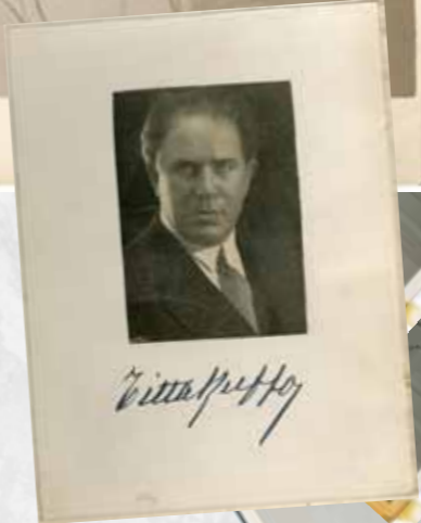
○ TITTA RUFFO