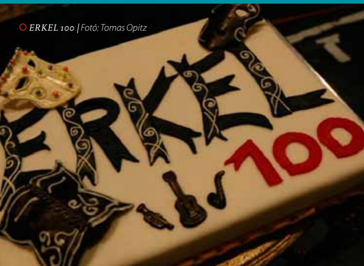
ERKEL 100