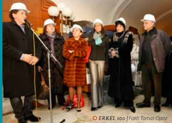
ERKEL 100

Jótekonysági gálaesttel és árveréssel kívánta az Operaház vezetősége és művészei kiegészíteni a Kormány által az Erkel Színház felújítására szánt összeget, mert ahogyan 2011 telén Ókovács Szilveszter fogalmazott: „az Erkel néppoperai hagyományai, valamint az a küldetése, hogy elérhető áron, elérhető közelségbe hozza az operát, balettet, musicalt a budapesti és a vidéki közönség számára egyaránt, mindenkinek fontos.” ErKell nekünk! címmel hirdették meg az újjáépítéshez kapcsolódó jótekonysági célú összefogást. A kezdeményezés nyitó eseménye volt a 2012. február 18-ai Erkel estély, amelyhez az opera és a balett világához kapcsolódó értékes relikviák – többek között híres énekesek jelmezeinek, valamint exkluzív festményeknek és dísz tárgyaknak – árverésre bocsátása társult. Több mint hatvan, nemzetközi híru magyar operaénekes és balettművész – köztük a jövő művészgenerációjának számos képviselője – lépett színpadra 2012. február 18-án este hét órakor