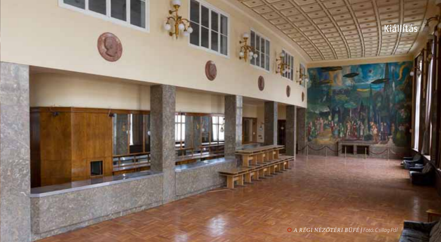
A RÉGI NÉZŐTÉRI BÜFÉ