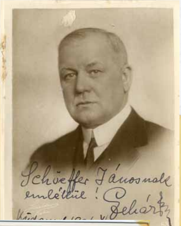
○ LEHÁR FERENC