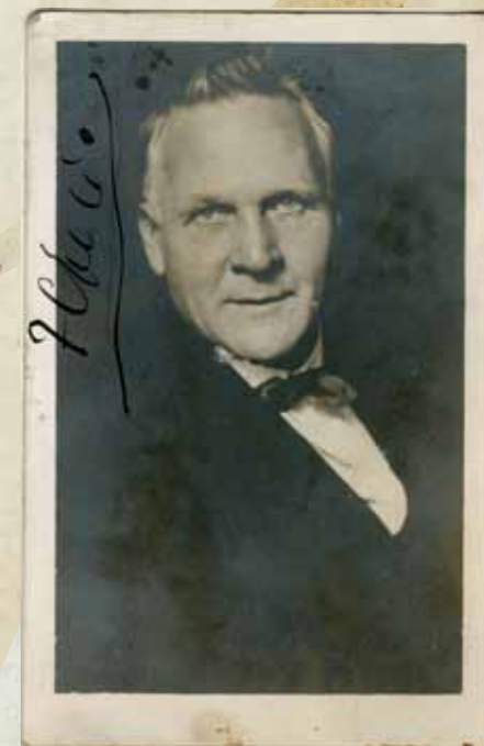
○ FJODOR SALJAPIN | Fotó: Operaház Emlékgyűjtemény

(Péterfi István, Magyar Hírlap , 1927. május 15.)