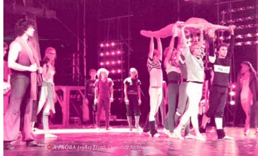
○ A PRÓBA (1982)