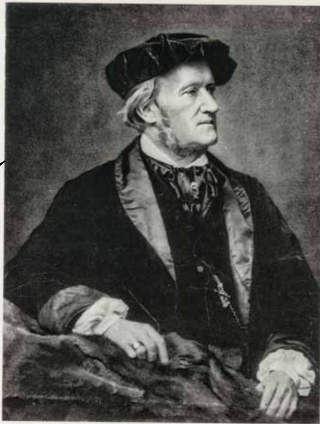
○ RICHARD WAGNER

Ez az öregség emelkedése. Sokat kellett szenvednie, sok minden mindegy lehetett már, megjárta az élet fölfelé vezető lépcsőit, túl lehetett asszonyon, mómoron. Ekkor már tisztán, nyugodt pillantással állhatott szemtől-szembe Parsifallal. Őszintén, belülről jövő hittel vallhatta, hogy az emberiség szenvedését az a makulátlan friss egyszerűség