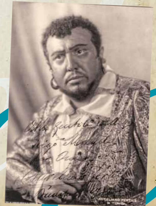
○ AURELIANO PERTILE