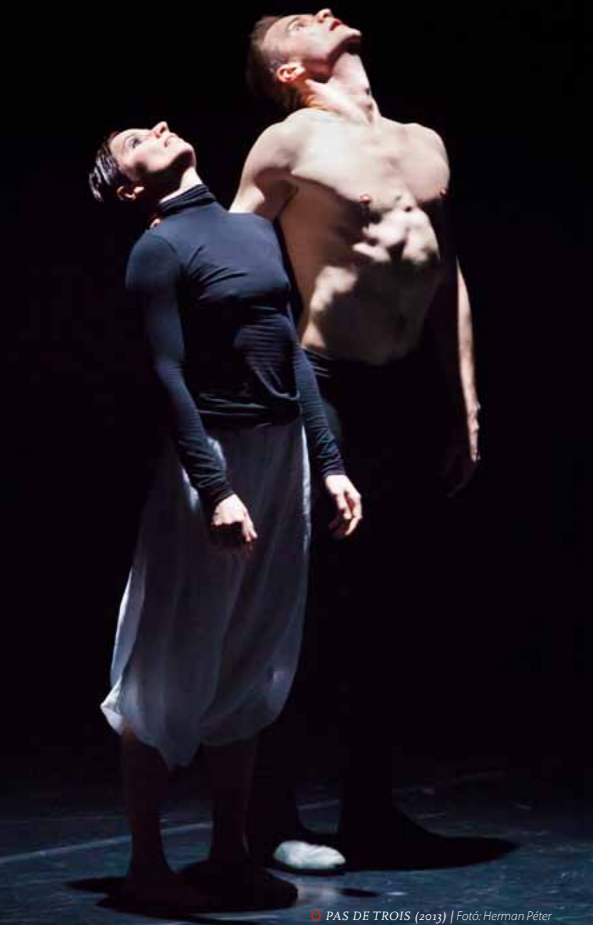
○ PAS DE TROIS (2013)