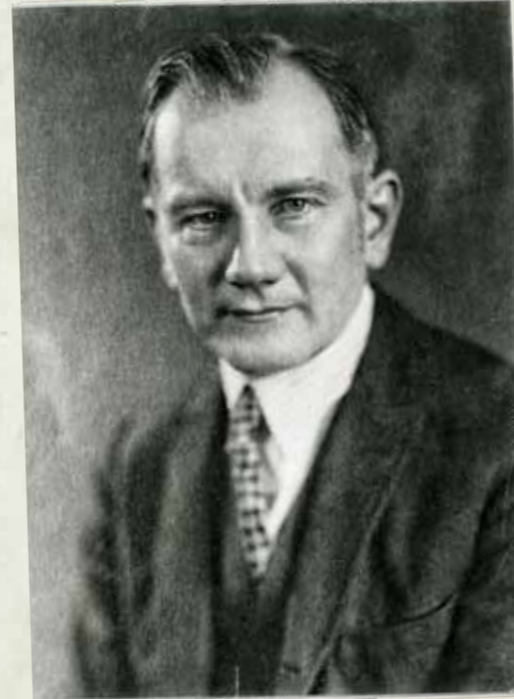
○ DOHNÁNYI ERNŐ

(Péterfi István, Újság, 1939. június 13.)