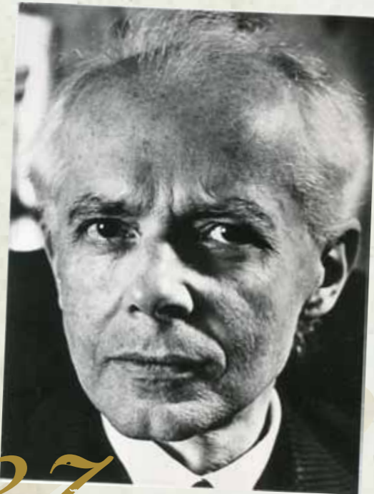
○ BARTÓK BÉLA | Fotó: Operaház Emlékgyűjtemény

„Az operaszínpad hírességei nem ritkán akkor kerülnek hozzánk, mikor a fényes név már nem jelöl hasonlóan ragyogó hangot. Talán ez is volt az oka, hogy Aureliano Pertile keddi első budapesti bemutatkozására meglepően kevés közönség jött el a Városi Színházba. Pedig a nagy olasz énekes még mindig pályája zenitjén áll. Orgánuma töretlen, fortéiban és pianóiban egyformán tiszta zengésű világos tenor, művészetének szuggesztivitása, lendülete pedig olyan magával ragadó, hogy szüntelenül varázslatában tartja minden hallgatóját. Pertile minden vonatkozásában a legkiemelkedőbb egyéniségei közé tartozik minden idők operaénekesének. (...) Nagyszerű Otellójáról egész tanulmányt lehetne írni.”