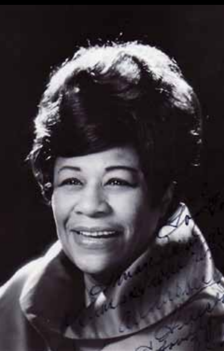
○ ELLA FITZGERALD