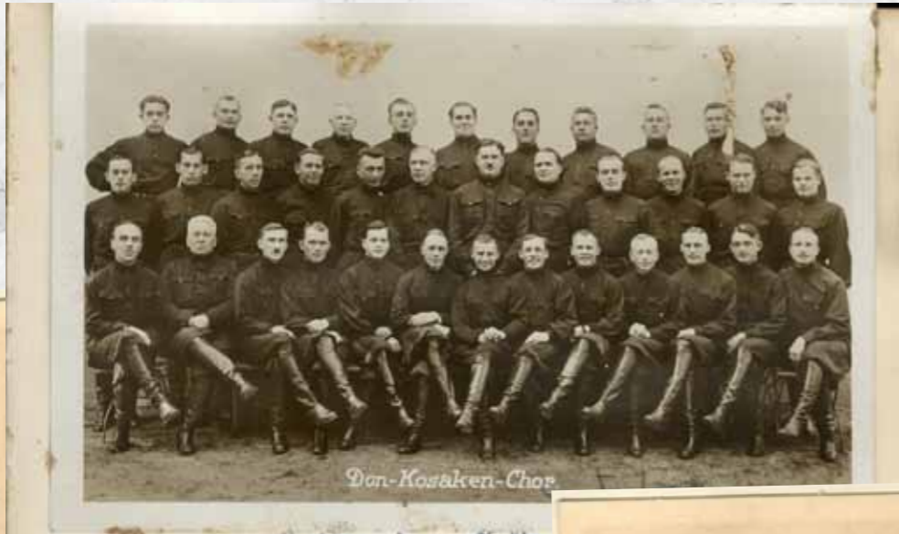
○ A DONI KOZÁK KÓRUS TAGJAI