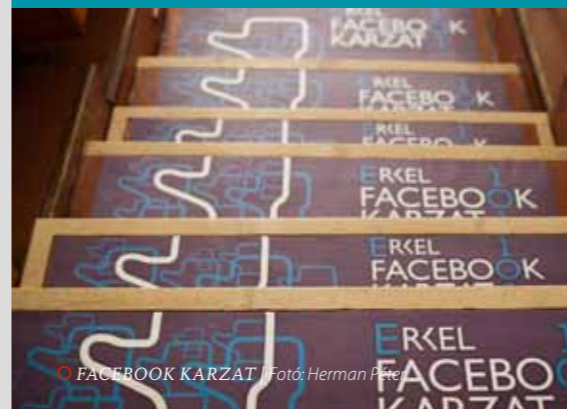
○ FACEBOOK KARZAT