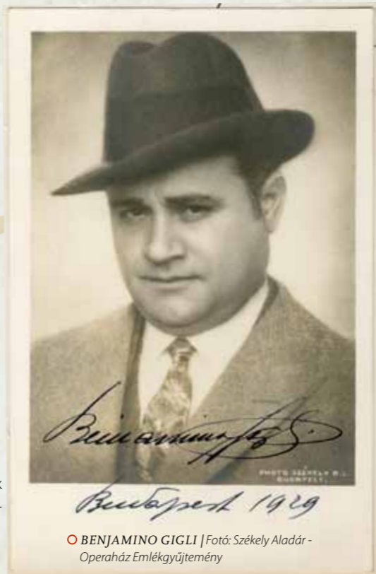
○ BENJAMINO GIGLI

„ Saljapin pontosan azt a Don Quijotét keltette életre, akit Cervantes olvasása közben képzelünk. Nem a késői Massen-et-operáért, hanem Saljapinért telt meg pénteken este a Városi Színház óriási nézőtere. (...) Massenet neki írta, és mással alig képzelhető el. Nem is tudunk róla, hogy más is mert volna vállalkozni Saljapin után, hogy fellépjen ebben a szerepben. A nagy orosz művész Cervantes »búsképű« lovagjának egész tragikumát megérezkelteti. Századok irodalmának halhatatlan alakja kel életre, és nemcsak tragikum,