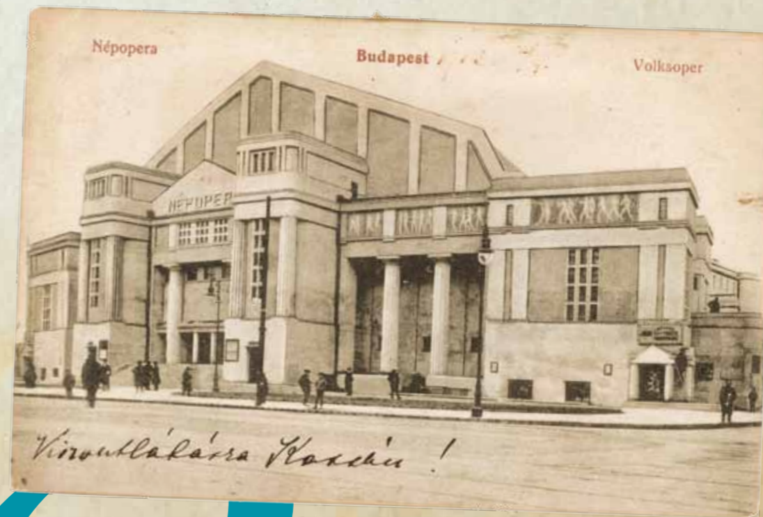
○ NÉPOPERA (1912)