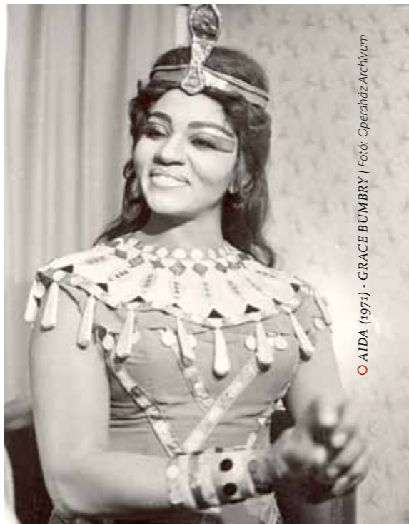
○ AIDA (1971) - GRACE BUMBRY | Fotó: Operaház Archivum

vélekedett: „A Lohengrin -felújítás különös élményt kínál. Az előadás egyidejűleg két síkon zajlik: egyfelől a Wagner-zene droghatásáról lemondó, de a Wagner-zene intenzív átélhetőségét mégis biztosító zenei interpretáció, másfelől az életproblémák ellentmondásos wagneri stílzálásának-mitizálásának radikális kritikáját adó színjáték síkján. Kétségtelen: a nem szervesen fejlődő és nem up to date magyar operajátás ilyenre nem készítette fel a közönséget, s ezért a reflektálatlanul csodált remekmű problematizálása sokkolja konzervatív többségét. De aki tud a művészet és a történelem, a művészet és az élet, a művészet és a világ nem éppen egyszerű és törésmentes viszonyáról, annak számára a két egymással ellentétes ábrázolás egyidejű befogadása, a két ellentétes élmény interferenciája komplex, izgalmas, sőt pompás művészi élvezet lehet.” Azt már döntsük el mi magunk, egy ilyen esetben hová billen a mérleg nyelve, a minden nem-historikus ábrázolást kifütyülőknél vagy a másik oldalnak adunk igazat.