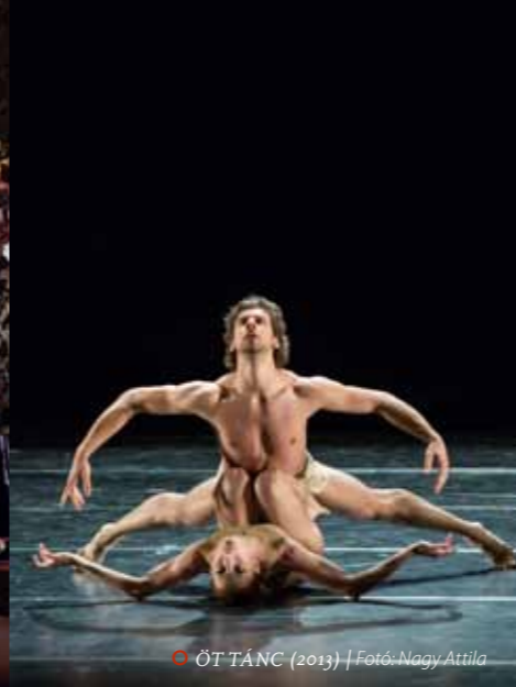
ÖT TÁNC (2013)