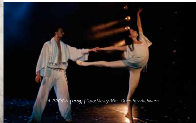
○ A PRÓBA (2005)

E kompozíciók közül a legnagyobb hatású, leghosszabb utóéletű – nemzetközi szinten is, hiszen több országban bemutatták, és négy televízió készített belőle filmet – a Próba volt. A zenét Presser Gábor szerezte és állította össze Bach-művekből, a koreográfiát Fodor Antal jegyezte. Az előadást vegyes érzelmekkel fogadták: „Az előadók: minden dicséretet megérdemelnek! Teljes erőbedobással hozzák tudásuk javát, színészi ábrázoló erejüket.