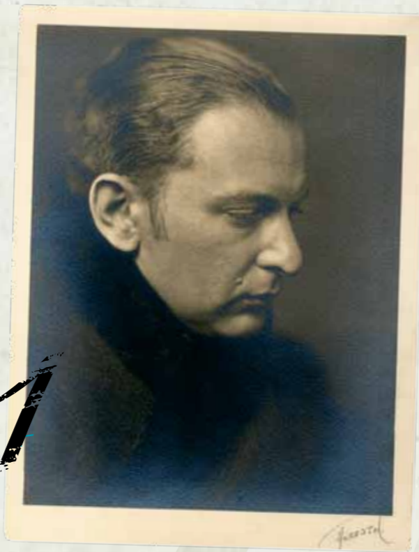
○ REINER FRIGYES