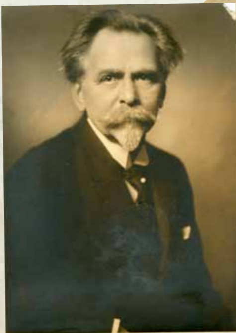
○ HUBAY JENŐ