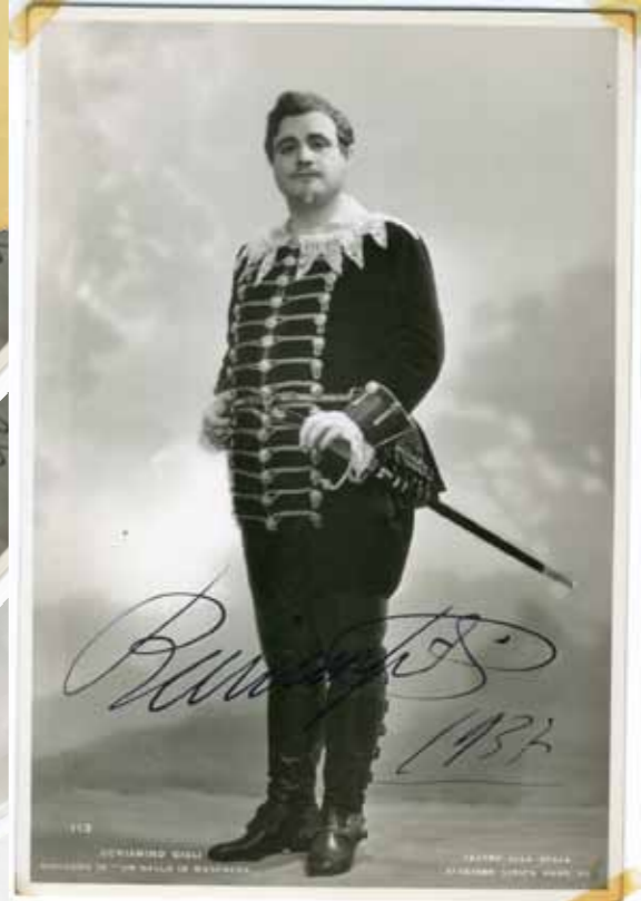
○ BENIAMINO GIGLI