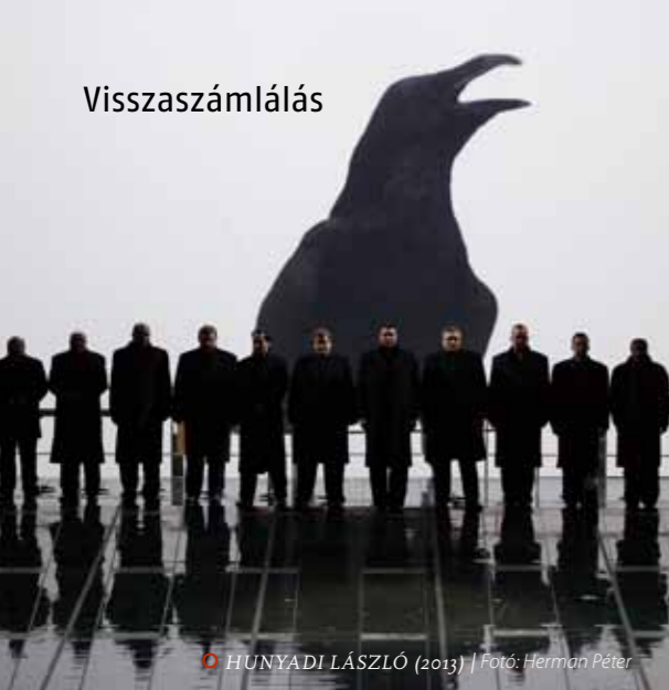
HUNYADI LÁSZLÓ (2013)