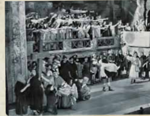
○ QUO VADIS?

Azt hiszem, hogy valamennyien ezért vártuk a Népoperát, ezt vártuk tőle. És a színház mai megnyitó-előadása után teljes határozottsággal állíthatjuk, hogy nem vártunk hiába. Első előadásul a Quo vadis -t hallottuk. A librettó a francia Henri Cain munkája. A muzsikát pedig a spanyol [!] Jean Nougès írta. A szöveggönyv a Sienkiewicz-féle regény hat részletét mutatja be. Az előadásról csak általánosságban írhatunk. Pompás volt. Örvedetesen friss, lelkesedéssel, szorgalommal, hozzáértéssel keresztülvitt. Hasonló operai rendezést még nem láttunk e hazában.