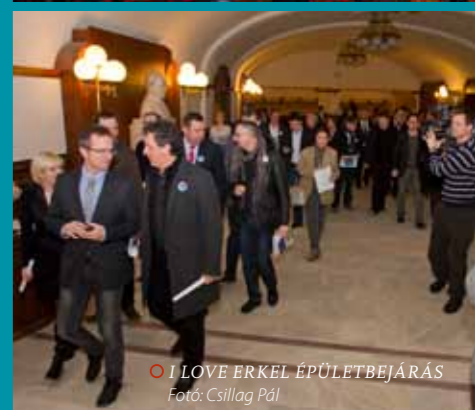
○ I LOVE ERKEL ÉPÜLETBEJÁRÁS