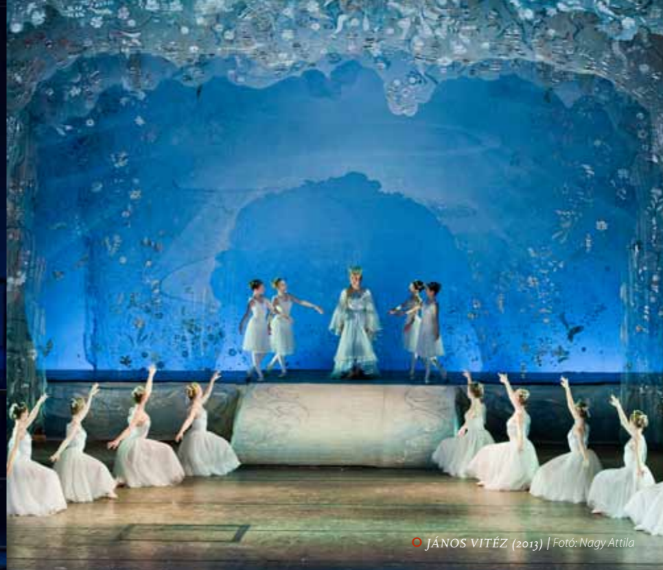
○ JÁNOS VITÉZ (2013)

A visszajelzések arról is tanúskodnak, hogy bár sokaknak ez volt az első találkozása az operával – sőt, vannak olyanok, akiknek ez volt az első színházi élményük –, a műfaj nem csupán csatát, de háborút is nyert, elkötelezett operakedvelőket eredményezett. Ám nemcsak a fiataloknak volt akkora élmény, hogy utána napokig volt téma a releváns magyar-, történelem- és énekórákon vagy a szünetekben,