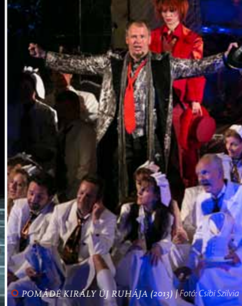
POMÁDÉ KIRÁLY ÚJ RUHÁJA (2013)