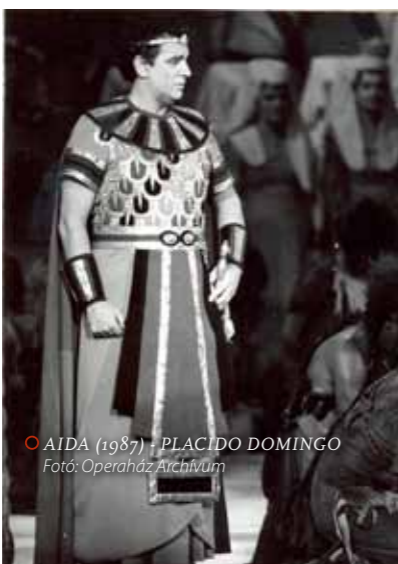
○ AIDA (1987) - PLACIDO DOMINGO

A vendégszerepléseket, különösen a külföldi művészekét mindig különönböztetett figyelem kísérte. Nagy beharangozót kaptak, a kritikák pedig szinte minden egyes alkalommal annak a mondatnak a parafrázisát változtatva kezdődtek, hogy: a kritikus nagy várakozással tekintett az előadás elé, ugyanakkor félelemmel is, mert ki tudja, hogy a hozzánk érkező világsztárt milyen énekesi kondícióban hallja, hiszen a lemezeken erőteljes hang a színpadon elgyöngülhet, erős rendezők és partnerek nélkül a színészi képesség elveszhet, a legkisebb hiba pedig egy ismert előadó esetében könnyen csalódást keltő. Egy vendégszereplés szakmailag igen fontos, hiszen egymás előtt megmérettetik vendég és fogadó egyaránt.