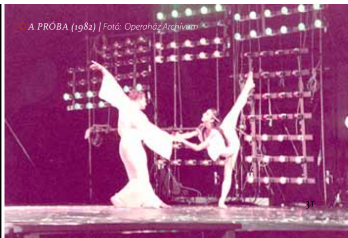
○ A PRÓBA (1982)