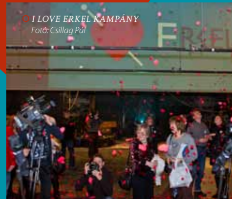
○ I LOVE ERKEL KAMPÁNY